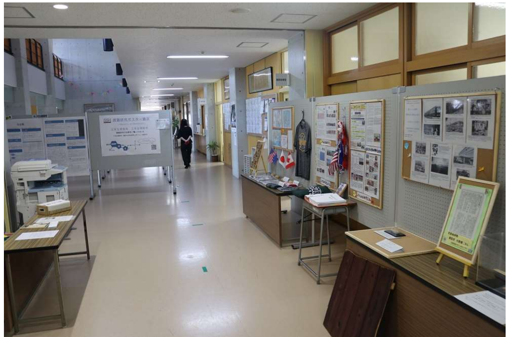
「生き方が道」 「SSH」「留学」など 学際分野の紹介パネル