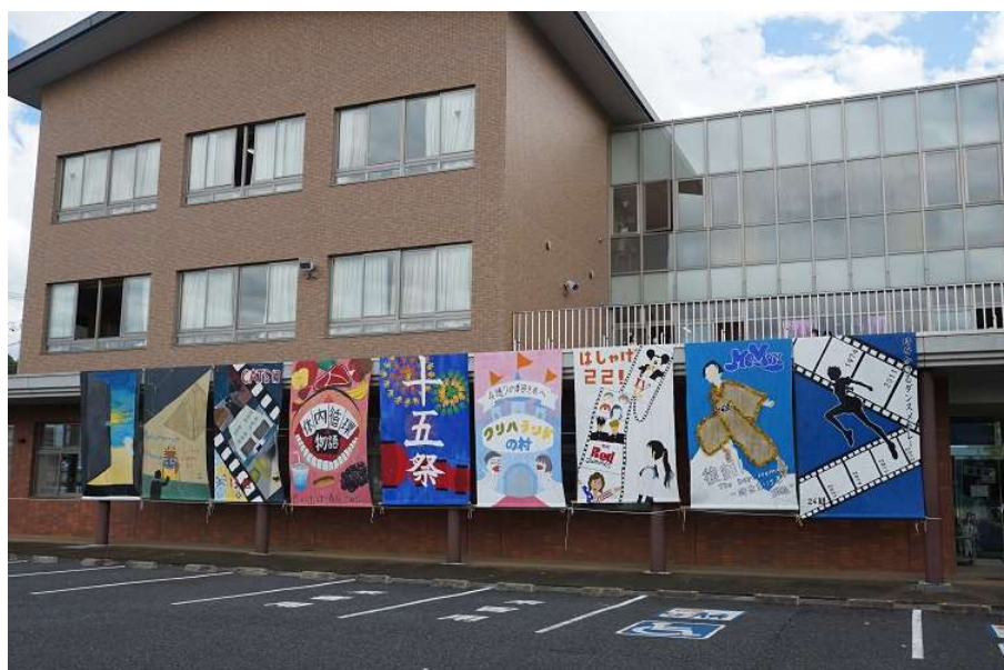
各クラステーマ幕（一部）

新型コロナ感染対策の為、 2020 年は観客無し・2021 年は中止と通常開催出来なかった城陵祭文化の部 が9月6,7日に行われました。30 年を超える伝統の土日文化祭、PTA バザー、一般来場は見送られたようですが、 徹底した感染対策し生徒の他保護者 1 名の観客も加わって実施された城陵祭文化の部の一端を提供頂いた画像で紹介します。