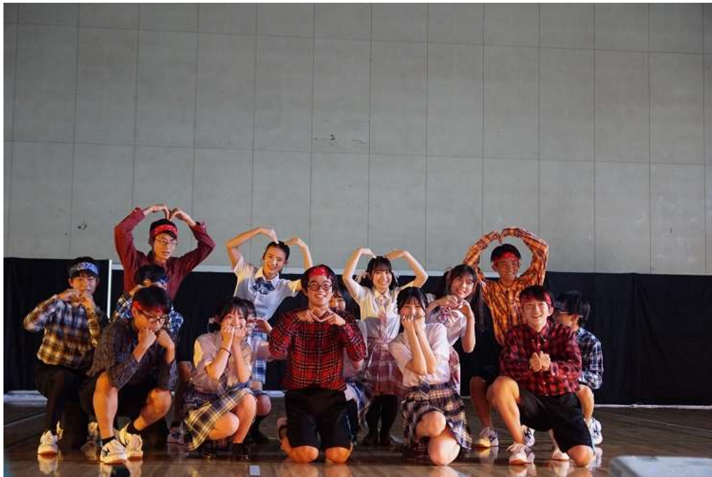
2年生「演示」 第2体育館で行われる パフォーマンス